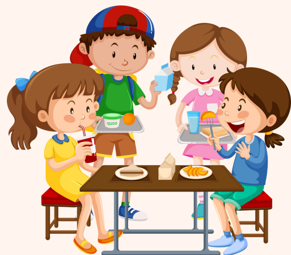
Almuerzo - Colación