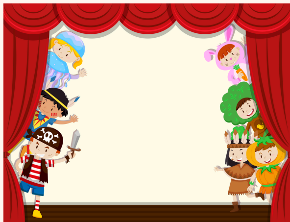
Juego de roles