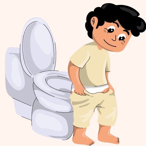
Ir al baño

A través de pequeñas acciones diarias y rutinas establecidas, formamos hábitos, y fortalecemos la seguridad y autonomía en nuestros estudiantes.