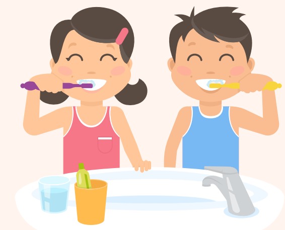
Lavarse los dientes