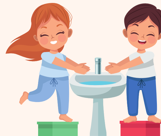
Lavarse las manos