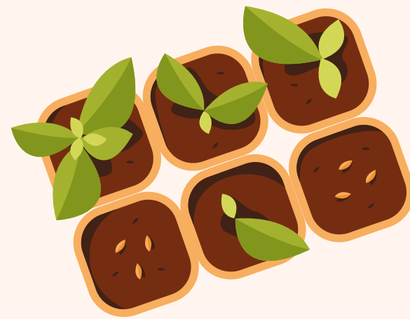
Semillas y flora