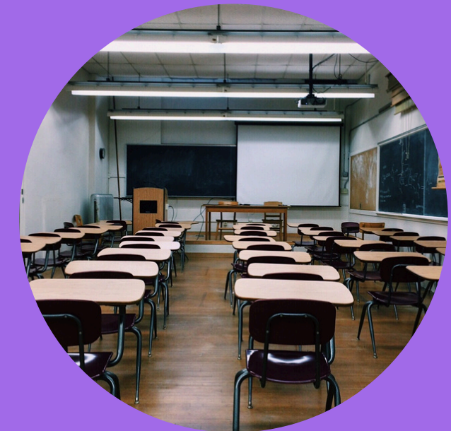
POLITICA NACIONAL DE CONVIVENCIA ESCOLAR 2024 - 2030